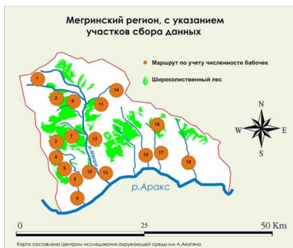
Рис. 1. Точки сбора материала в Мегринском районе Армении.

1 – оз. Капуйтлич; 2 – с. Таштун; 3 – с. Вагравар; 4 – с. Гудемнис; 5 – с. Курис; 6 – с. Личк; 7 – летовки Лишквас; 8 – с. Карчеван; 9 – Агарак; 10 – с. Левваз; 11 – с. Ванк; 12 – с. Варданидзор; 13 – Мегри; 14 – с. Калер; 15 – с. Алдара; 16 – летовки Гюморац; 17 – с. Шванидзор; 18 – с. Нрнадзор.