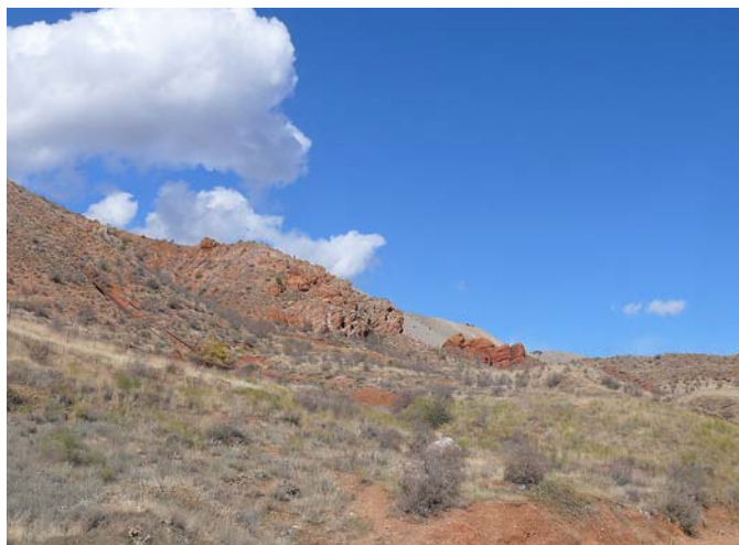
Рис. 2. Участок глинистой полупустыни в окрестностях Агарака.

1 – Kapuytlich lake; 2 – Tashtun vill.; 3 – Vaghravar vill.; 4 – Gudemnis vill.; 5 – Kuris vill.; 6 – Lichk vill.; 7 – Lishkvas summer vill.; 8 – Karchevan vill.; 9 – Agarak; 10 – Lehvaz vill.; 11 – Vank vill.; 12 – Vardanidzor vill.; 13 – Meghri; 14 – Kaler vill.; 15 – Aldara vill.; 16 – Gyumorats summer vill.; 17 – Shvanidzor vill.; 18 – Nrnadzor vill.