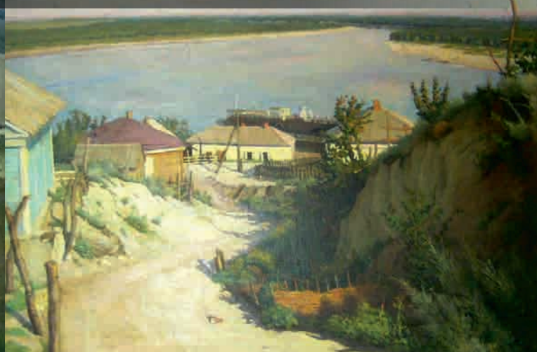
Печной спуск. Худ. П.С. Куркин. 1941 г.