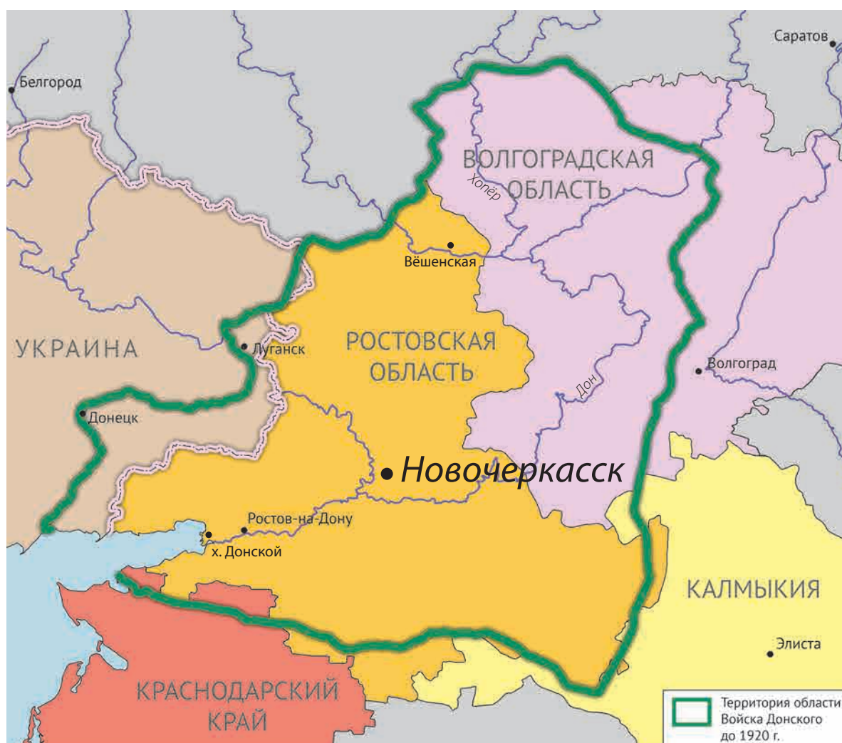
Границы области Войска Донского на карте XX в.

Южный научный центр РАН на протяжении 15 лет не один раз обращал внимание профессионалов и общественности на проблему коллапса водных ресурсов, уникальной фауны, упадка некогда богатейших рыбных запасов Азовского моря и Дона. Власти знакомились с разработками РАН, но поступали исходя из своих представлений о целесообразности. Уход