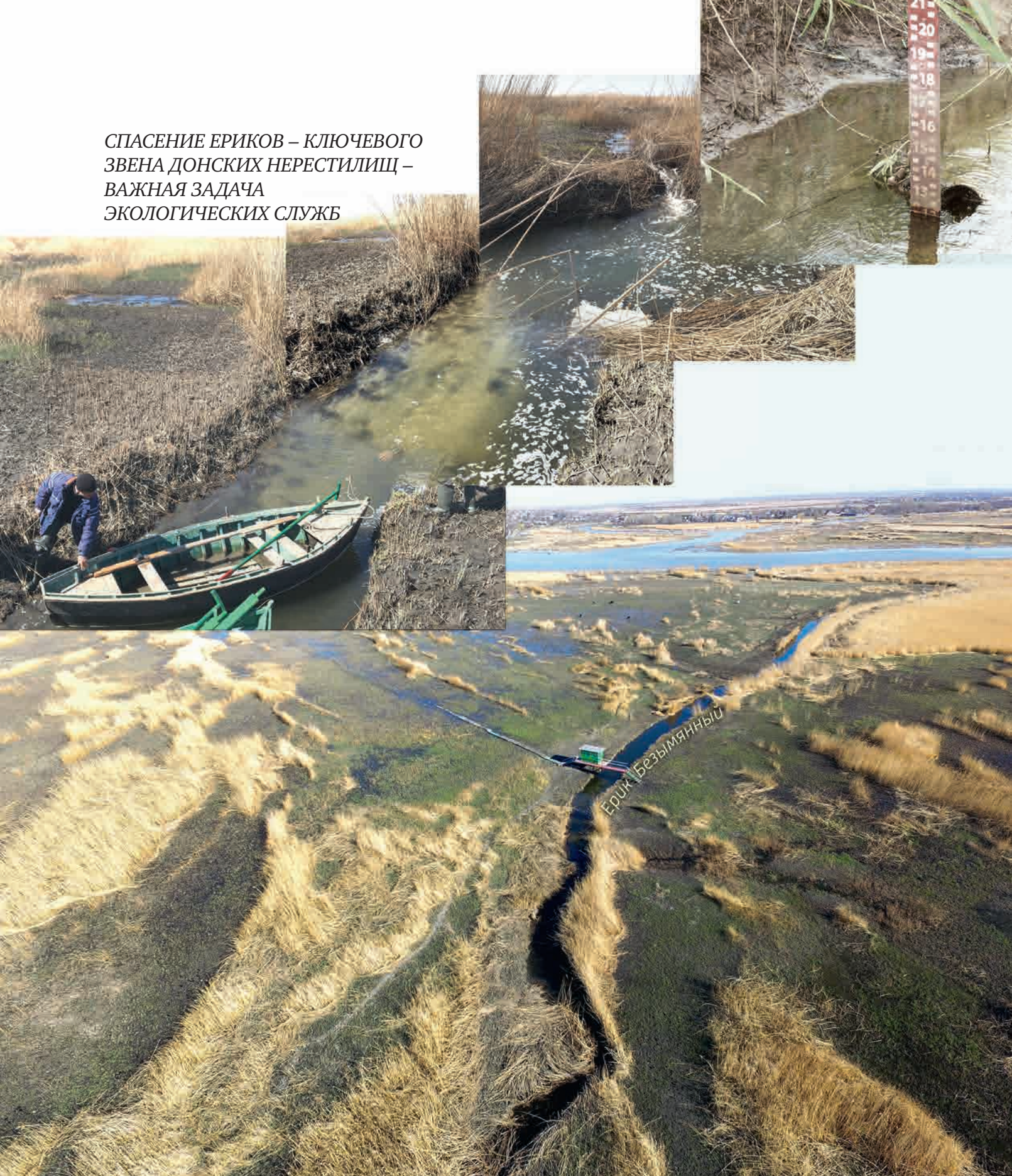
Фотографии из экспедиции ЮНЦ РАН, 2017 г.