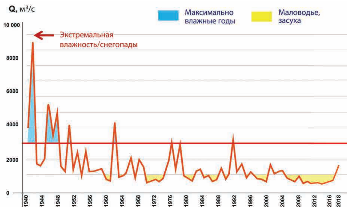
Максимальный среднемесячный расход р. Дон в ст. Раздорской за период 1940–2015 гг.

Возможность улучшить нынешнюю ситуацию, безусловно, есть. Но жесткая экономия бюджетных средств сегодня уже заставила частично свернуть планы природоохранных проектов в стране. При любых экономических обстоятельствах стране нужна целевая федеральная программа по спасению от гибели экосистемы Дона и Азовского моря.