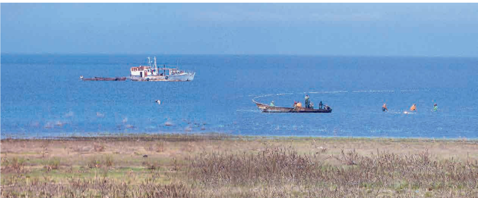
Левый берег Цимлянского водохранилища. Фото из экспедиции ЮНЦ РАН, апрель 2016 г.

Анализируя максимальные среднемесячные расходы воды у станиц Раздорской более чем за 70 лет, можно сделать однозначный вывод – сейчас в водосборном бассейне Дона дефицит воды достиг критического уровня: ее в требуемых объемах нет и в ближайшие годы не предвидится.