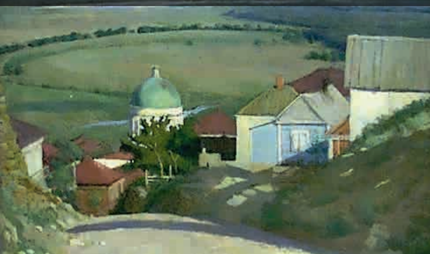
Каменный спуск. Худ. П.С. Куркин. 1940 г.