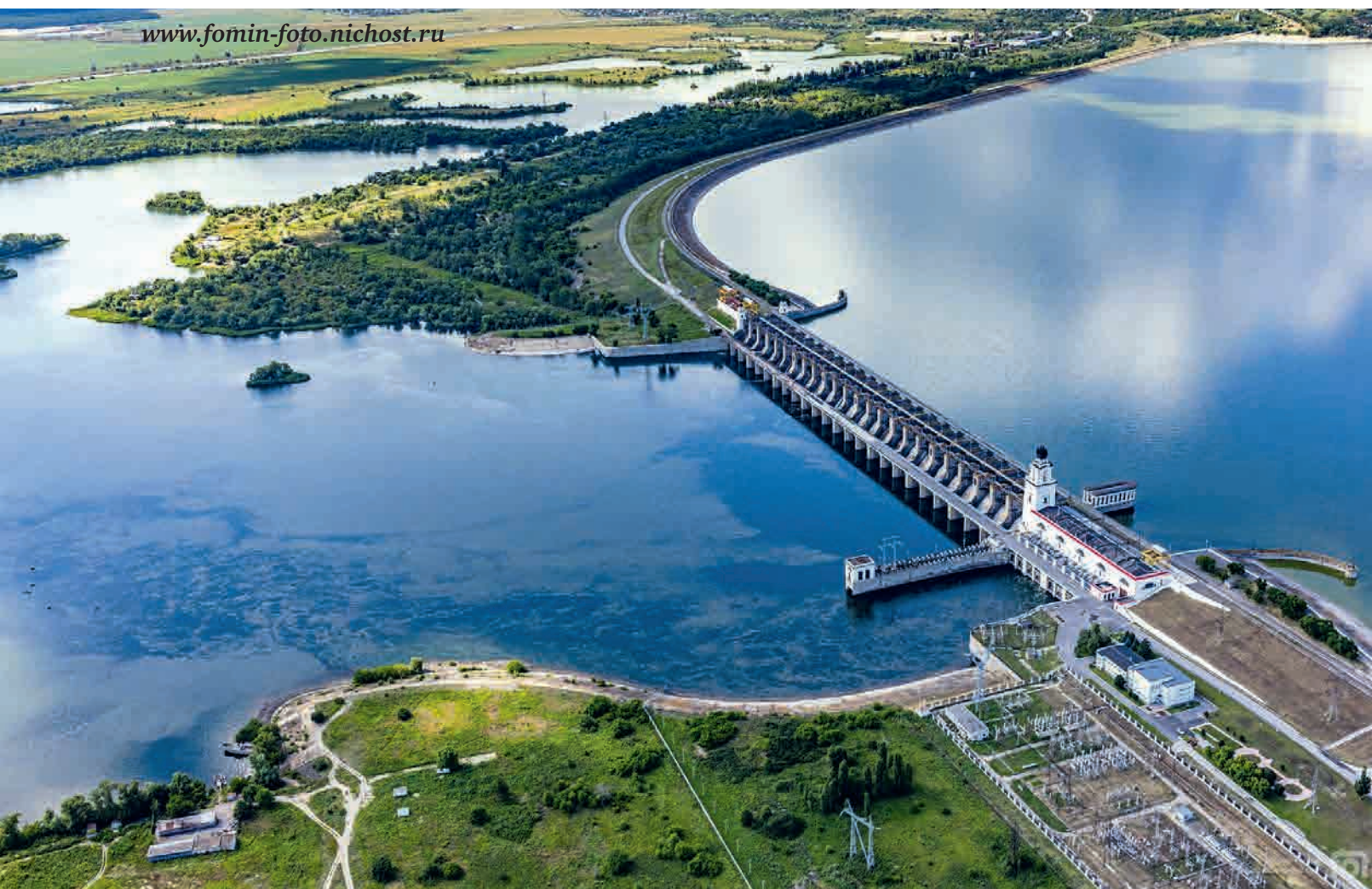
Цимлянская ГЭС. 2016 г.

Само по себе коммунистическое строительство вовсе не предполагало существования каких-либо особых сословно-этнических групп, подобных казачеству, хотя они как казаки-колхозники еще принимали повышенные социалистические обязательства в честь окончания строительства Волго-Донского судоходного канала имени В.И. Ленина. Донцов еще