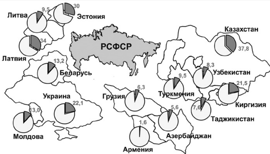
Рис. 2. Доля русских в населении союзных республик СССР с начала 1990-х гг. (млн чел.) 1

В ближнем зарубежье России отчетливо выделяются несколько макро-регионов: северо-западный (страны Балтии), западный (Украина, Белоруссия и Молдавия) и два южных (Закавказье, а также Средняя Азия с Казахстаном). Динамика русских общин в каждом из этих крупных ареалов