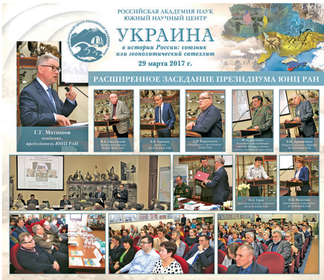
Расширенное заседание Президиума ЮНЦ РАН «Украина в истории России: союзник или геополитический сателлит». 29 марта 2017 г.

ЮНЦ целесообразно продолжить «атласную» аналитику, которая была востребована гражданской и военной властью. Атласы были и должны остаться визитной карточкой ЮНЦ.