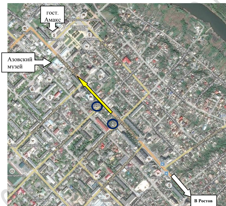
г. Азов. Центр

Схема проезда на Береговую научно-экспедиционную базу ЮНЦ РАН «Кагальник» Ростовская область, Азовский р-н, с. Кагальник, ул. Береговая, 58а с. Кагальник