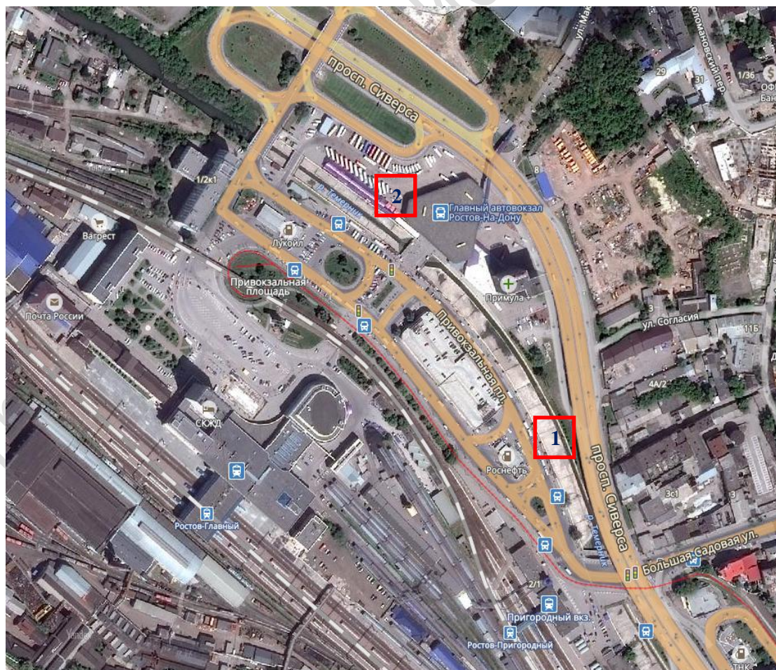
г. Ростов-на-Дону, привокзальная площадь

Выход в г. Азове на ост. по требованию Красноармейский пер. или ул. Измайлова, при повороте с ул. Московской. Далее пешком по ул. Московской до Петровского бульвара, Петровской площади и направо.