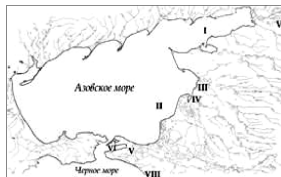
Рис. 1. Карта-схема районов исследования.

В период с 1995 по 2001 г. были исследованы: российское побережье Азовского моря (I