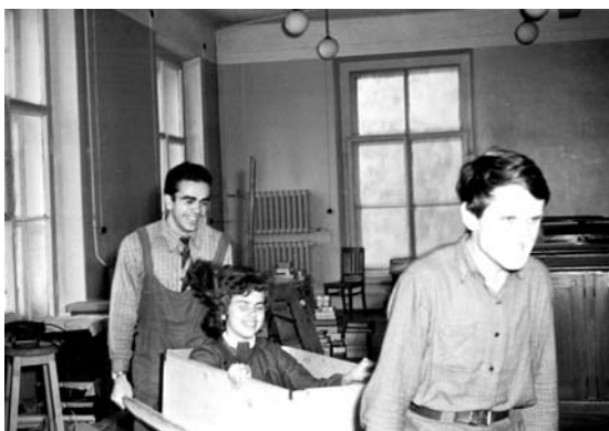
В.Ф. Зайцев. Переезд лаборатории после капитального ремонта. 60-е годы.

Return of the laboratory after capital repairs (the sixties).