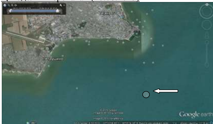
Локализация цитадели «Черепаша»