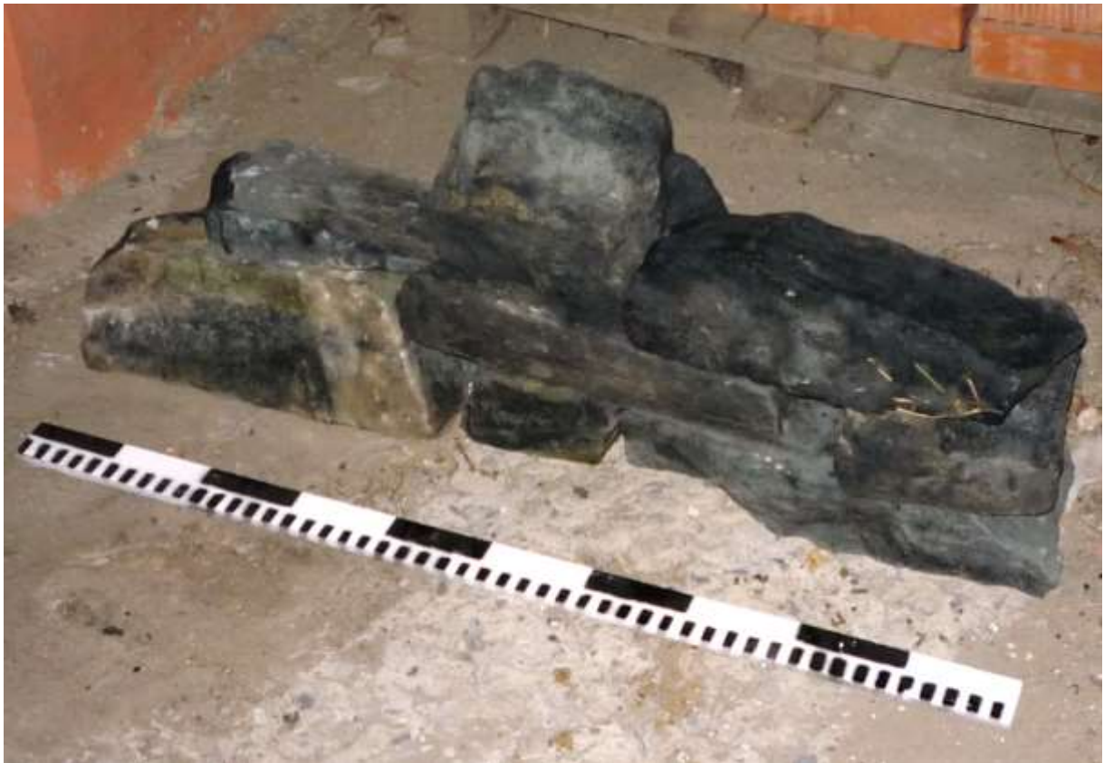
Камни из фундамента турецкой башни-каланчи, поднятые со дна гирла Каланча в результате подводной разведки