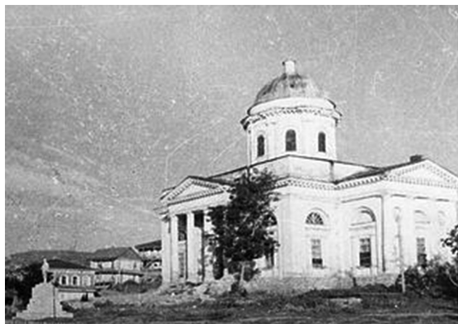
Рис. 5. Свято-Никольский храм, станица Цимлянская, 1937 г. Fig. 5. St. Nicholas Church, stanitsa Tsimlyanskaya, 1937.

землю под огороды [7]. Были потеряны сады, виноградники, организованное огородничество – все то, что ранее приносило доход [8].