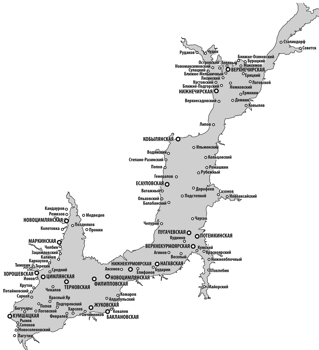
Рис. 1. Населенные пункты, затопленные Цимлянским водохранилищем. Fig. 1. Settlements flooded by the Tsimlyansk reservoir.

реселения жителей с этих территорий. Согласно проекту уровень Цимлянского водохранилища был 31–36 м, а призма сработки водохранилища – 5 м. Было решено переносить населенные пункты, попадавшие под отметку 37 м. Затоплением водами Цимлянского водохранилища было затронуто 3 административных района Ростовской области