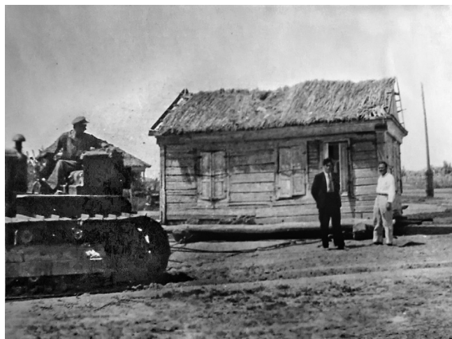
Рис. 2. Перевозка дома без разборки, станция Верхне-Курмоярская.

Fig. 2. Transportation of the building without disassembly, stanitsa Verkhne-Kurmoyarskaya.