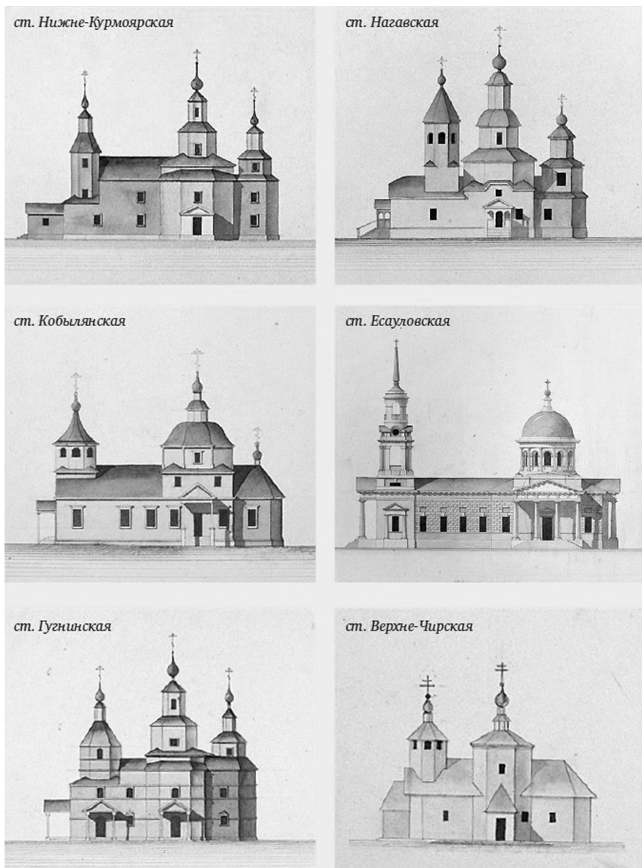
Рис. 4. Храмы, затопленные Цимлянским водохранилищем. Акварель Е.А. Ознобишина. Fig. 4. Temples, flooded Tsimlyansk reservoir. Watercolor by E.A. Oznobishin.