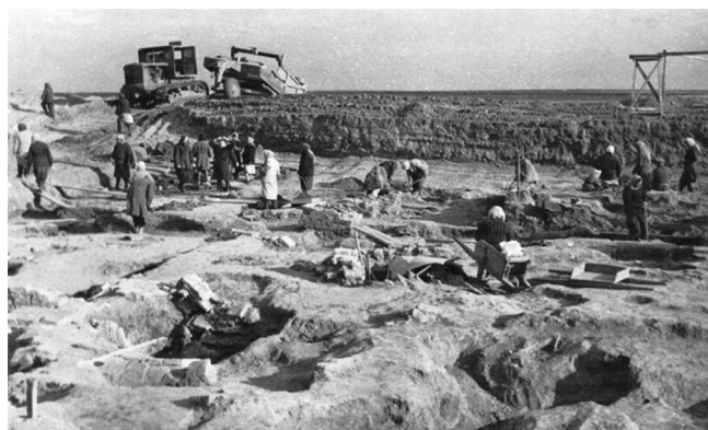
Рис. 7. Женщины-заключенные, работающие на раскопках крепости Саркел, в экспедиции проф. М.И. Артамонова в 1949–1951 гг.

Таким образом, исследование показало: значительное изменение состава населения, произошедшее в середине XX века и вызванное реализацией народно-хозяйственных проектов, обусловило упа-