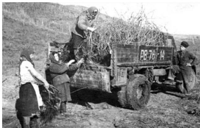
Рис. 3. «Переселение» виноградной коллекции.

В Ростовской области средняя дальность переселения составила 13 км, а в Сталинградской – 10 км. Только отдельные населенные пункты переносились на дальние расстояния. Так, например, станция Нижне-Курмоярская Цимлянского района Ростовской области была перенесена в хутор Рябичи-Задонский Волгодонского района на планируемые орошаемые земли на расстояние 140 км, хутор Кулалы – в хутор Черкасский на расстояние 100 км. В Сталинградской области на относительно большие расстояния были перемещены станция Верхне-Курмоярская (70 км) и хутор Ватажный Нижне-Чирского района (90 км) [2].