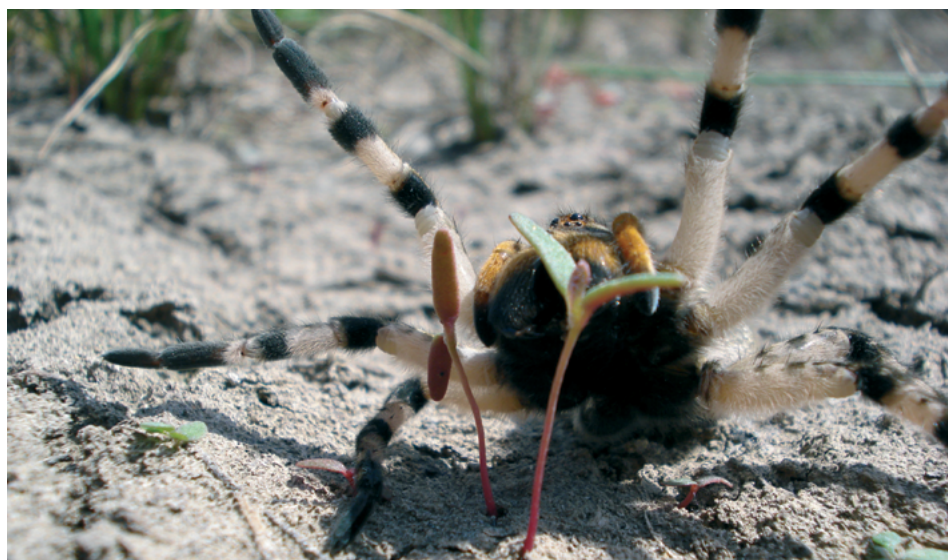
Рис. 5. Самка тарантула ( Allohogna singoriensis ) в угрожающей позе