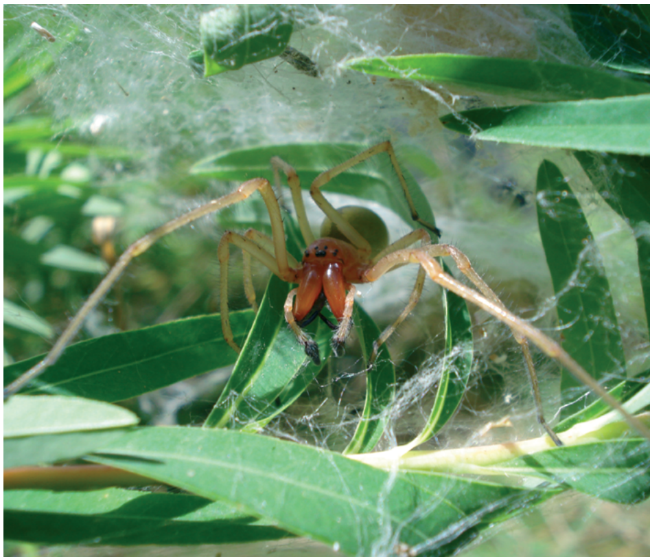
Рис. 3. Cheiracanthium punctorium , самец

Особи Ch. punctorium очень агрессивны и могут укусить даже при незначительном контакте с ними. Учитывая эту особенность их поведения, а также возможность контакта с этим пауком при работах на огородах, плантациях и особенно на ягодниках и виноградниках, серьезные последствия укуса, необходим контроль за численностью Ch. punctorium , а также проведение профилактических мероприятий, направленных на предупреждение возможности поражения людей этим пауком.