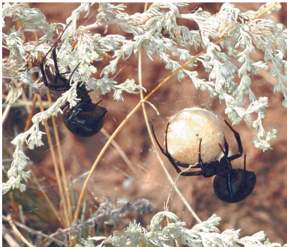
Рис. 7. Самки каракурта ( Latrodectus tredecimguttatus ) с коконом

По наблюдениям 2019 г. состояние городских популяций каракурта можно охарактеризовать как вполне удовлетворительное. Так, в конце июля 2019 г. было отмечено начало откладки яиц, причем данные по интенсивности откладки, количеству коконов и яиц в них характеризуют процесс размножения как успешный. В обнаруженных кладках в зависимости от сроков начала кладки было от 2 до 5 коконов [Пономарёв, 2021в].