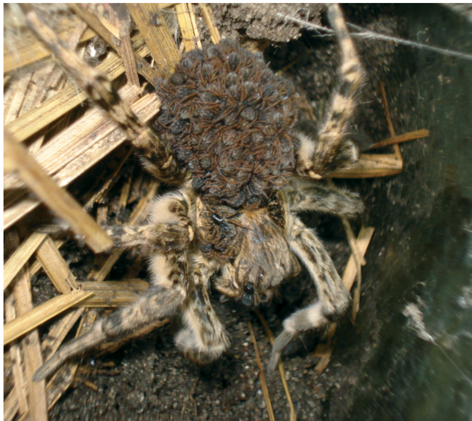
Рис. 6. Самка тарантула ( Allohogna singoriensis ) с молодью

стью для человека. Скорее наоборот, он должен стать объектом охраны как уникальный представитель фауны юга России, тем более что в последнее время наблюдаются явные признаки сокращения как численности, так и ареала южнорусского тарантула.