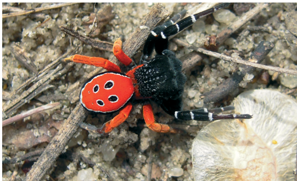
Рис. 1. Eresus kollari , самец

перемещаются в поисках самок. В населенные пункты, а тем более в жилища человека не проникают. Половозрелые самцы и самки встречаются в конце лета – начале осени.