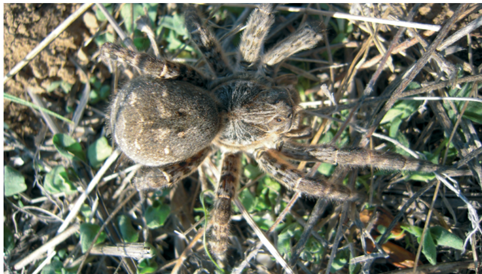
Рис. 4. Южнорусский тарантул ( Allohogna singoriensis ), самка

мится убежать), естественный страх большинства людей к паукам и природные знания о его потенциальной опасности фактически сводят на нет его контакт с человеком. Поэтому тарантул не может являться объектом пристального внимания в связи с его опасно-