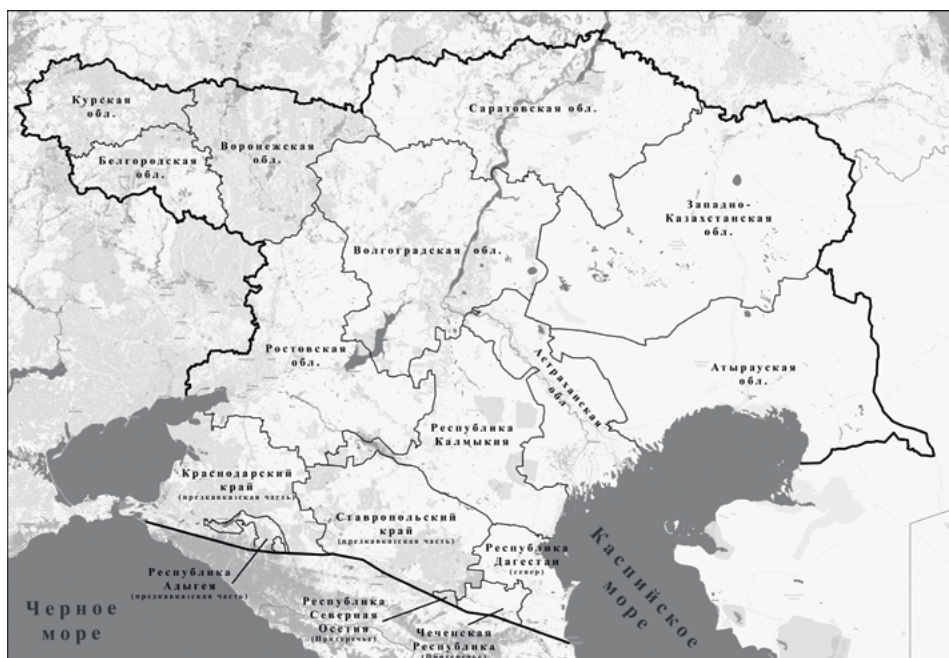
Карта 1. Территория исследования