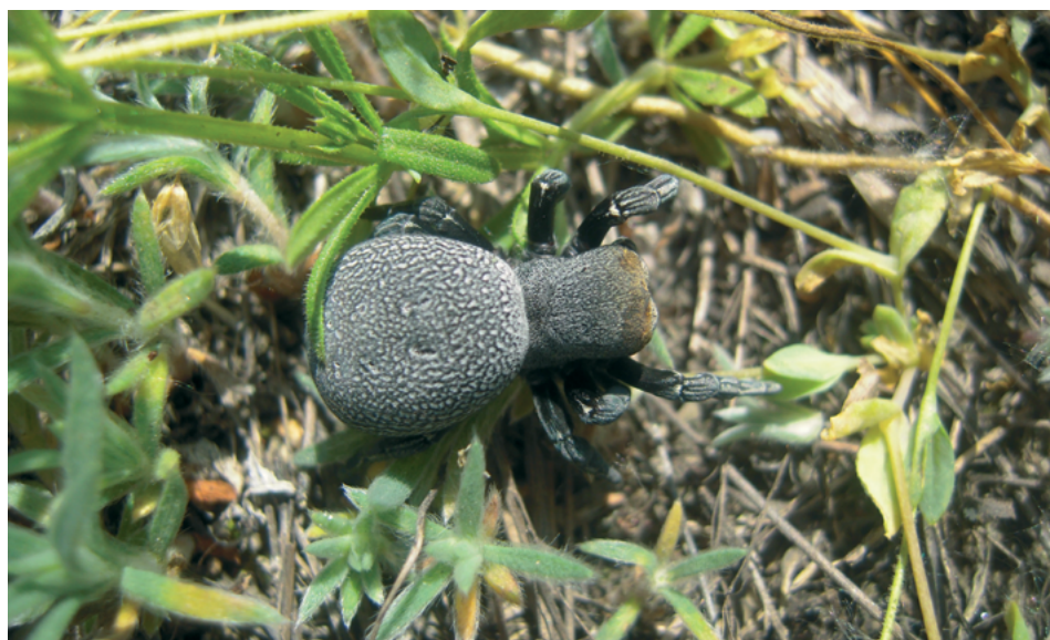
Рис. 2. Eresus kollari , самка